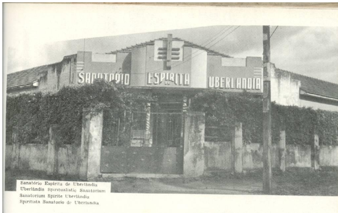
Sanatório Espírita de Uberlândia. In: ORLANDI, Vittorio. Enciclopédia Ilustrada das Obras Espíritas v. 1. São Paulo: Editora Urânia, 1961