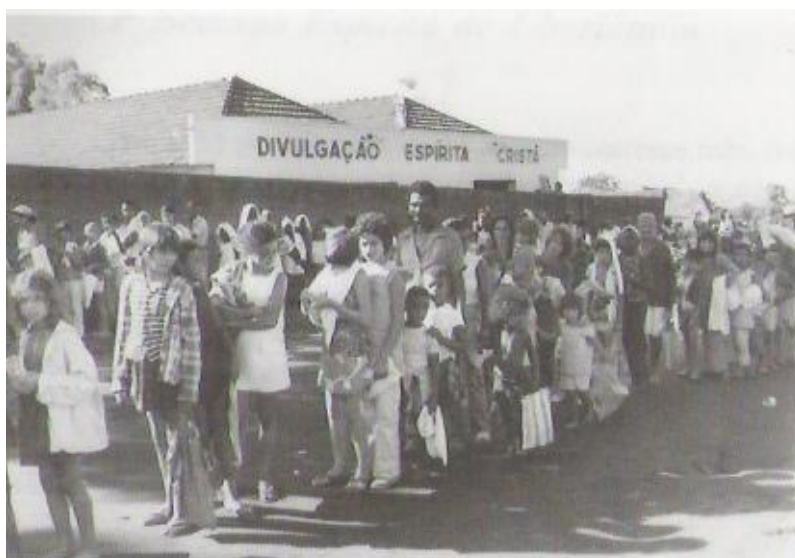
Distribuição de cestas básicas de Natal às famílias pobres. In: VITUSSO, Isabel R. Terra Fértil Semente Lançada. A história do espiritismo em Uberlândia. Uberlândia: Aliança Espírita Municipal, 2000, p. 115