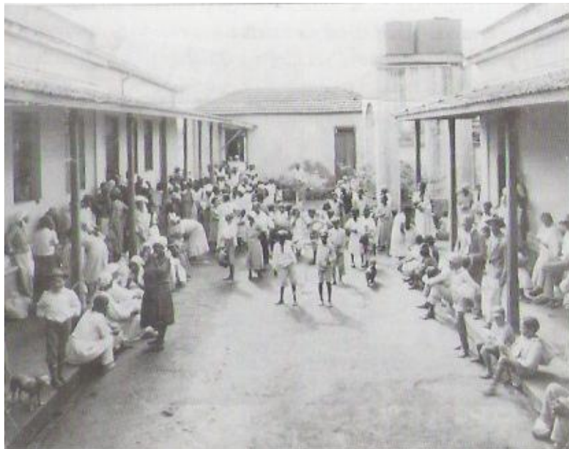
Dispensário dos Pobres. In: VITUSSO, Isabel R. Terra Fértil Semente Lançada. A história do espiritismo em Uberlândia. Uberlândia: Aliança Espírita Municipal, 2000, p. 89.