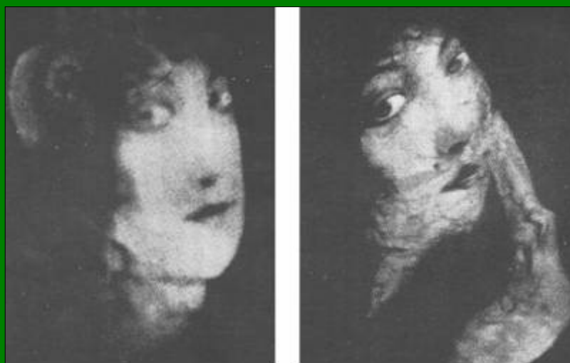
Ampliações dos rostos de duas das materializações minúsculas obtidas nas sessões

produziu. Notarei que o ideal dos metapsiquistas foi sempre o de obter fenômenos físicos em plena luz diuturna e que dessa vez chegou-se a atingir o fim desejado. Os experimentadores tiveram oportunidade de seguir a evolução de uma materialização minúscula, em todas as fases do seu desenvolvimento, desde o aparecimento de um núcleo de ectoplasma que, alongando-se e condensando-se, modelou-se como por encanto, sob os seus olhos, começando as suas transformações por uma das extremidades. Viram surgir daí uma fina cabeleira loura que chegava até a cintura da forma feminina em miniatura, a qual, depois de toda formada, se moveu, levantando, deitando-se, subindo na médium e deixando-se colocar na palma da mão dos espectadores para desaparecer em seguida, bruscamente, e depois de reaparecer, não menos repentinamente, menor ainda. Essas circunstâncias eliminam, de modo absoluto, qualquer possibilidade de fraude, sendo, pois, absurdo duvidar-se da autenticidade dos fatos.