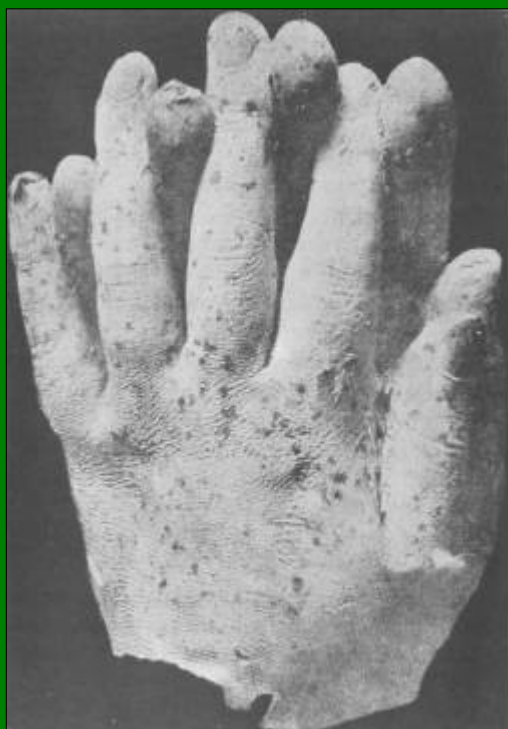
Um par de luvas de parafina com os dedos das mãos entrecruzadas, mostrando grãos do corante colocados na cera para melhor autenticá-lo.