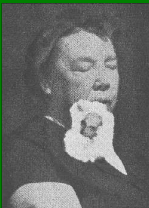
Materialização ectoplásmica minúscula do rosto de “Walter”, o falecido irmão e “guia espiritual da médium Margery.