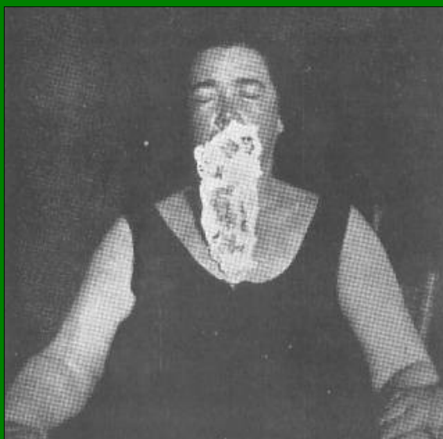
Abundante emissão de massa ectoplásmica, mostrando rostos minúsculos de pessoas mortas, que foram reconhecidas.

Limitamo-nos a fazer este resumo sem entrar no relato de inúmeros pormenores e abstando-nos, por outro lado, de comentários a respeito. Os fatos falam por si e são bem eloqüentes.