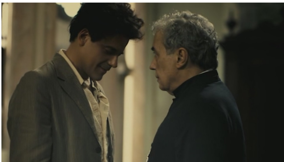
Figura 6: Diálogo

O diálogo continua sugerindo o distanciamento definitivo entre Francisco e a Igreja Católica. A tonalidade do discurso, acentuada na questão do estudo, do esclarecimento e do aprendizado também aparece nas imagens do filme, cuja leitura se propõe tendo como exemplo a imagem da Figura 6.