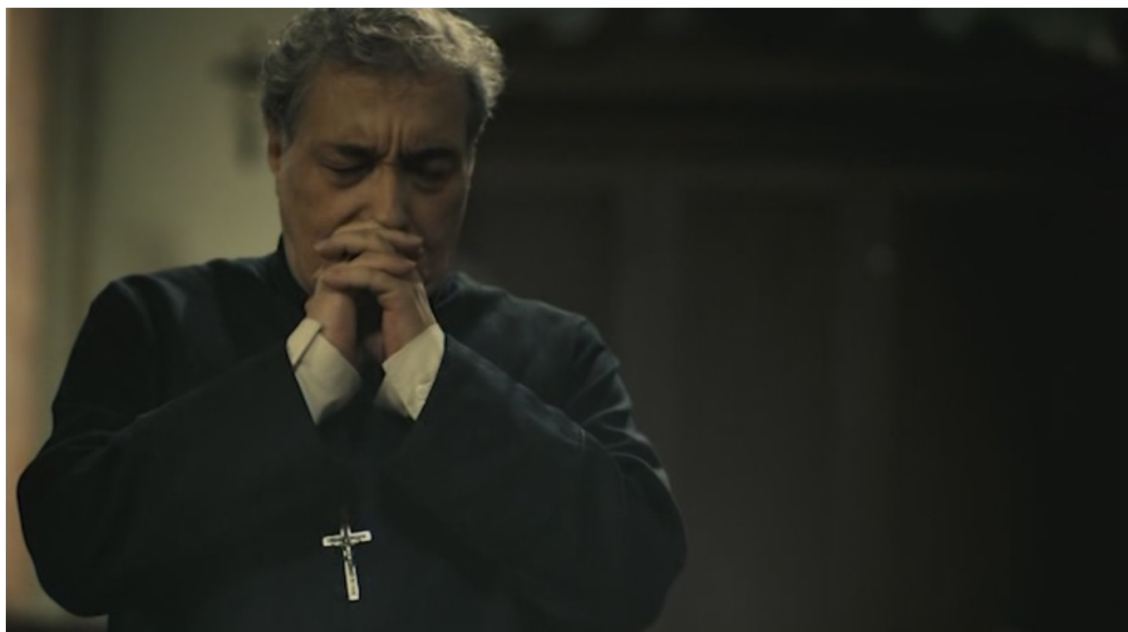
Figura 7: Oração

O sacerdote amigo se entrega à oração, após Chico se afastar. Nesse momento o padre fica no canto esquerdo do enquadramento em posição de fervorosa rogativa, conforme a Figura 7. Com a ausência do jovem médium, as luzes da fé raciocinada do Espiritismo se afastam e a escuridão que representa a fé católica no filme, predominam.