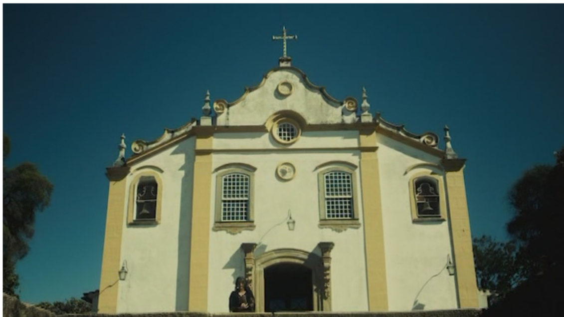
Figura 1: Igreja Católica

tragado pela igreja, saindo dali está a representação de uma mulher católica da época. O tom das vestes remete ao luto e reforça o aspecto de tristeza e obscurantismo. O interior da igreja também é escuro, as janelas são gradeadas, as linhas retas enquadram e oprimem. A igreja assemelha-se a uma prisão (fig.1).