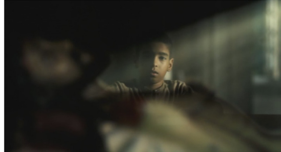
Figura 5: Protagonista focalizado

Em verdade, como demonstrado, essa é uma dialética constante, reforçada e agora aproximada. Como é característica do cinema clássico seguir fiel a um tema apresentada durante todo o enredo, assim se dá neste filme; a aproximação entre Chico e Cristo seguirá durante toda a narrativa.