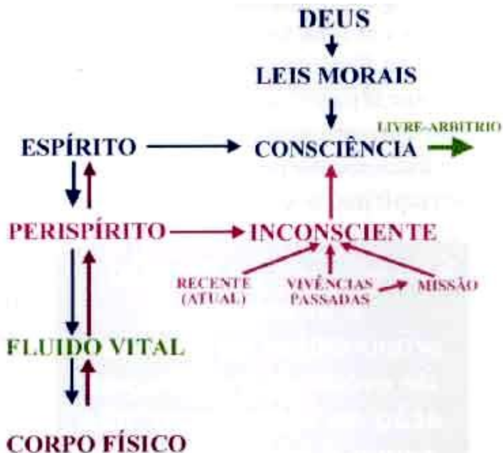
FIG.2: O "VOCÊ DECIDE" DO ESPÍRITO Decisão do Espírito, no uso de seu livre arbítrio, sob influência das ações encaminhadas pelo corpo físico, pelo inconsciente, e pelas Leis Morais impressas na sua consciência

A vontade do Espírito é diretamente proporcional ao seu grau de evolução e coroa sua ação no corpo físico "não sendo o perispírito mais do que um agente de transmissão", pois que no Espírito é que está a consciência... (grifos nossos) (3) (Fig. 2)